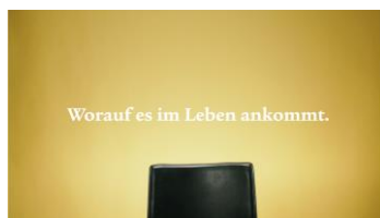
Worauf es im Leben ankommt