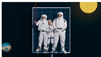
Eine Reise durch die Swiss Life-Gruppe

Die Swiss Life Holding AG mit Sitz in Zürich geht auf die 1857 gegründete Schweizerische Rentenanstalt zurück. Die Aktie der Swiss Life Holding AG ist an der SIX Swiss Exchange kotiert (SLHN). Zur Swiss Life-Gruppe gehören auch die beiden Tochtergesellschaften Livit und Corpus Sireo. Die Gruppe beschäftigt rund 7600 Mitarbeitende und rund 4600 lizenzierte Finanzberaterinnen und -berater.